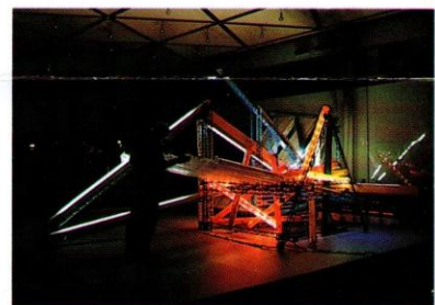
Kongreßcenter Düsseldorf Mai '91