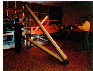
Art Frankfurt April '91

Die synthetischen Bestrebungen von Geldmacher und Kieselbach loten neue Möglichkeiten des künstlerischen Ausdrucks aus; sie zeigen, daß man die einzelnen Künstlersparten voneinander nicht trennen kann und auch nicht unbedingt trennen soll. Sie zeigen aber auch, daß trotz aller modernster technischer Mittel der Mensch als schöpferisches Wesen eine unabdingbare Voraussetzung wie im schöpferischen Prozeß so bei der Wahrnehmung der Kunst ist. Sie zeigt auch die enge Verbindung zwischen der künstlichen Welt, die sich der Mensch ausgedacht hat und der Natur, die in diesem Falle von ihm selbst repräsentiert wird.