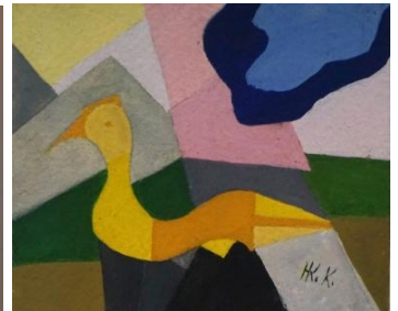
Vor-Bild von J.Kosnick.Kloss